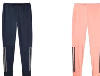
STR SG Q3 7/8レギンス W (AJ0131 / AI9668) ¥3,600 + 税

トレンドのスウェットアイテムをドレスっぽく仕上げました。裾と袖にリブを使用してすっきりと着用できる一枚です。