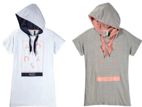
STR SG Q3 フーディーロングTシャツ W (AI9661 / AJ0124) ¥4,900+税

ロゴをボックスでグラフィックにしたデザインと、裾のアシンメトリな仕様がポイントです。