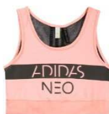
STR SG Q3 ブラトップ W (AI9666) ¥2,900+税

光沢のある素材を使い上品な仕上がりに。シルエットは程よくゆったりしたフィットです。