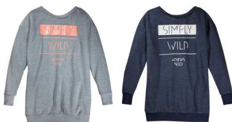
STR SG Q3 スウェットドレス W (AI9667 / AJ0130) ¥7,900 + 税

adidas neo セレーナゴメズ2015年 秋のコレクションは、スポーツシルエットにスタイリッシュなアクセントやフェミニンなディテールをブレンド。スウェットパンツやブラトップなどのカジュアルアイテムを、光沢のある素材でモード感を高めたり、裾や袖をリブ仕様ですっきりフェミニンなシルエットにすることで、スポーツリクスな着こなしを提案します。また、秋のファッションとレイヤリングの相性が良いアイテムも多数登場し、新鮮な着こなしが楽しめるラインナップとなっています。