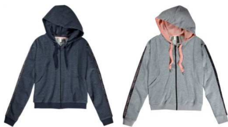
STR SG Q3 スウェットパーカ W (AI9664 / AJ0127) ¥8,900 + 税

程よいフィット感で、ひざ下のスリストライプスがレグラインをよりシャープに見せてくれます。