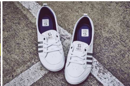
PIONA SG W (F98699) ¥5,300+税 (人工皮革)

サテンのライニングがフェミニンなフラットシューズ。シンセティックレザーのスリーストライプはさりげないリフレクターに。