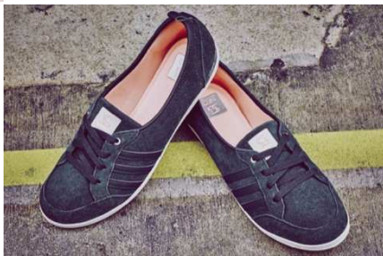
PIONA SG W (F98700) ¥5,900+税 (天然皮革)

ロゴをボックスでグラフィックにしたデザインと、裾のアシンメトリな仕様がポイントです。