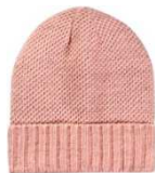
STR SG Q3 ビーニー W (AJ1004) ¥3,800+税

光沢のある素材を使い上品な仕上がりに。シルエットは程よくゆったりしたフィットです。