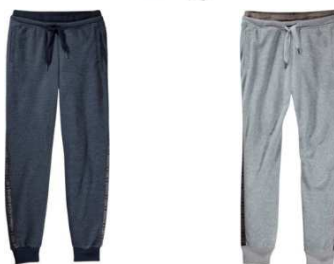
STR SG Q3 スウェットパンツ W (AI9665 / AJ0128) ¥8,900 + 税

光沢のある素材を使う事でスウェットパーカを女性らしいファッションアイテムに。ドロップショルダーとリラックスシルエットでスポーティ過ぎないシルエットがコーディネート幅を広げてくれます。