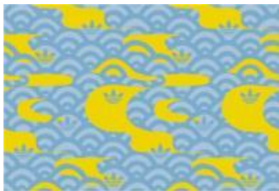
KUMO (CLOUD) / 雲