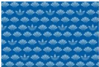
MATSU (PINE) | / 松

ダウンロードサイト: http://shop.adidas.jp/mizxflux/