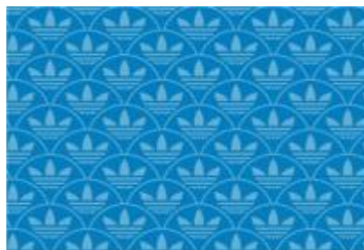
UROKO (SQUAMA) / 鱗