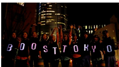
LED がついた「エナジービズ」を着用、 光る内容が変わり、大盛り上がり