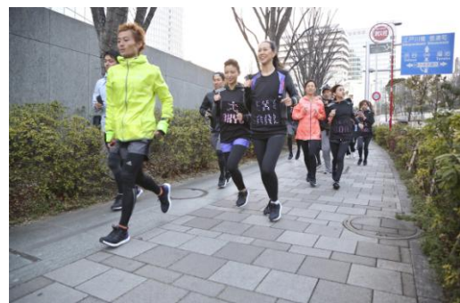
ランニングイベントも同時に開催