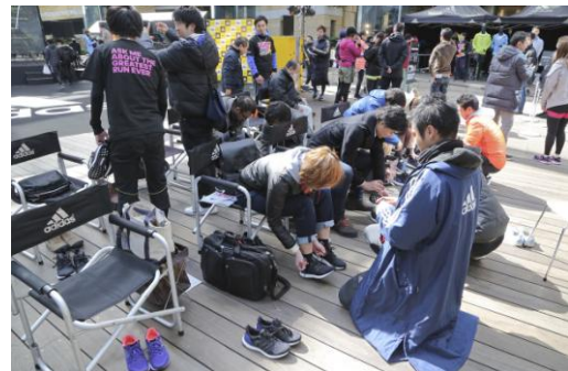
“ultra boost”を多くの方が試履きし、魅力を体感