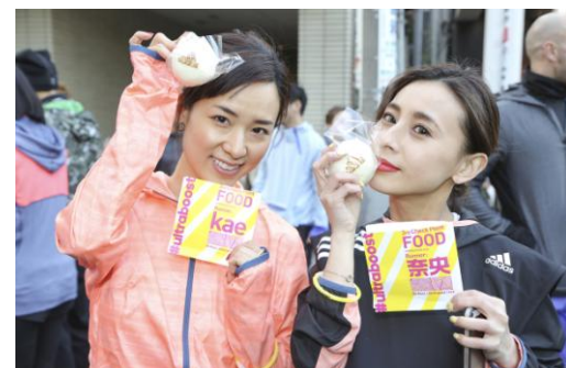
チェックポイントごとに、アトラクションを用意 ランナーの名前と adidas のロゴの入った饅頭も配られました