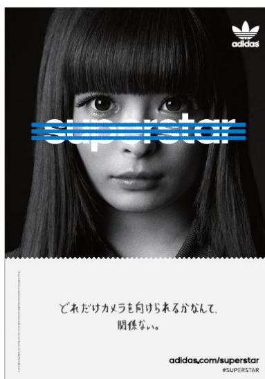
きゃりーぱみゅぱみゅ