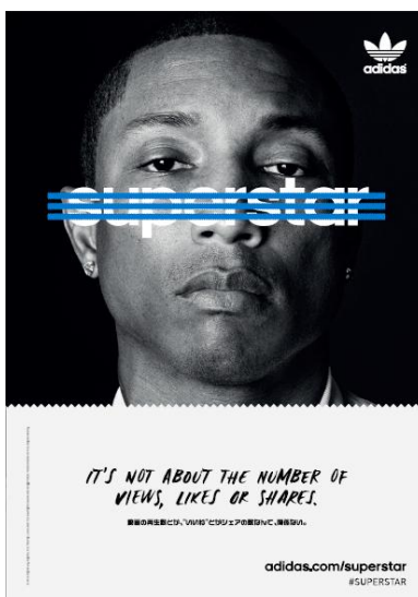
ファレル・ウィリアムス