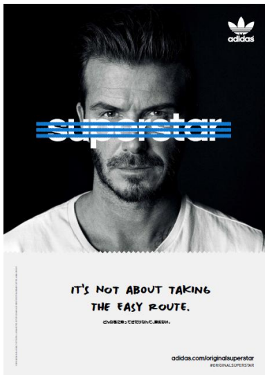
デビッド・ベッカム

#OriginalSuperstar キャンペーンムービー https://www.youtube.com/watch?v=0HYG0B70fa0