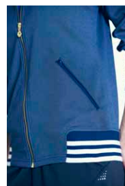
各部のリブにあしらわれたスリーストライプ。

「adidas24/7」のウィメンズモデルは、幅広いスタイリングを楽しめるデザインを追求。ヒップポケットや膝の位置を高くすることで、ヒップアップ & 足を長く見せてくれるシルエットを実現。ジップ付きポケット、UV カットなど女性のための機能も充実しています。袖や裾のリブにさりげなくあしらったスリーストライプなど、洗練されたデザインも魅力です。