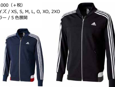
商品番号 S92671 カレッジネイビー × ホワイト

¥9,000 (+税) サイズ / XS, S, M, L, O, XO, 2XO カラー / 5色展開