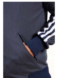
使いやすく、収めた物が落ちにくいポケット角度。