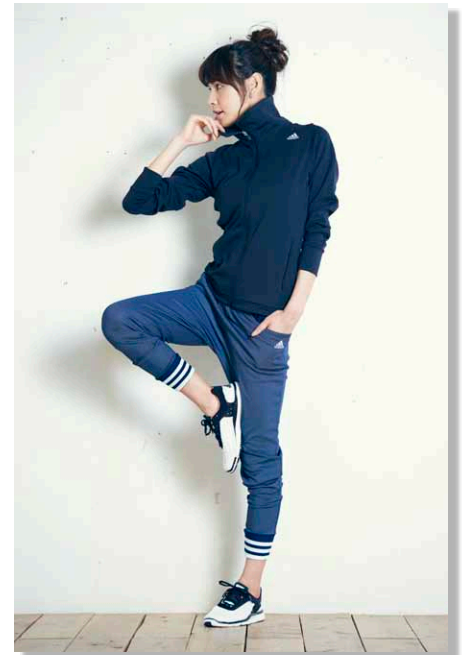
スウェットトップスとパンツのコーディネート

「adidas24/7」のウィメンズモデルは、スポーツシーンはもちろん、デイリーウェアとして着こなせるデザイン性の高さが魅力。セットアップはもちろん、デニム調の素材を生かして、ブルゾン、パンツとさまざまなコーディネートの組み合わせを楽しむことができます。