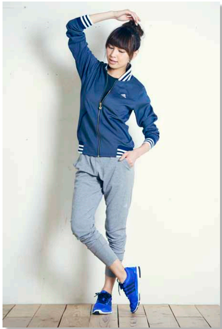
スウェットとブルゾンのコーディネート