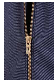
質感を高めるプラス調のジッパーを採用。