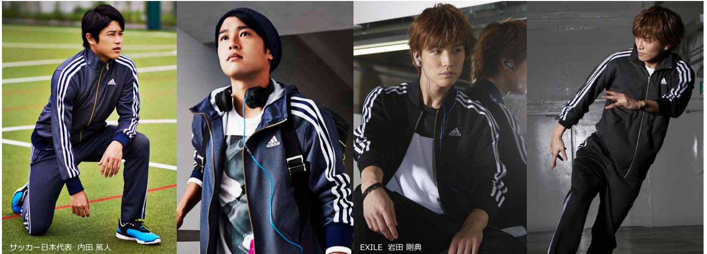
サッカー日本代表 内田 篤人