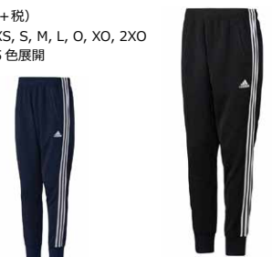
商品番号 S92663 カレッジネイビー × ホワイト

¥7,900 (+税) サイズ / XS, S, M, L, O, XO, 2XO カラー / 5色展開