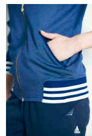
しっかりと収納できるジップ付きのポケットを採用。