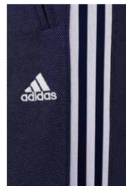
アディダス伝統の 48mm 幅のスリーストライプ。

「adidas24/7」のメンズモデルは、アディダスの往年のジャージに準じた伝統の 48mm 幅のスリーストライプや、フルレングス仕様のパンツのスリーストライプなど、ジャージらしいスタイルを追求。滑らかさと質感の高さを兼ね備えたプラス調の樹脂製ジッパーや、スタイリッシュなスタンドカラーなど、こだわりのディテールを備えています。