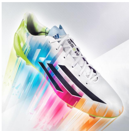
Новите adizero™ f50 Messi

Херцогенаурах, Лисабон, 17 февруари 2014 – Днес adidas представи новите обувки adizero™ f50, подписани лично от Лео Меси, които аржентинската звезда ще носи за първи път на осминафиналите на Шампионската лига на Европа на 18 февруари.