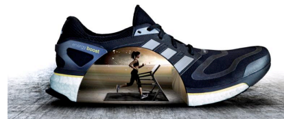
新感覚ランニング体験装置 「boost ランニングマシーン」

-3月9日(土)～3月10日(日) 11:00～17:00(最終受付 16:30)