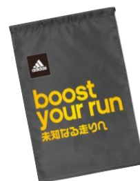
アディダス オリジナル フットウェアバック