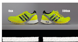
左: 使用前 0km 右: 使用後 500km シューズはプロトタイプ

『BOOST™ フォーム』は、500kmの走行後でもソールの劣化がしづらといった 耐久性 も特長のひとつです。また-20~40℃の環境下ではほぼ、形状変化が見られない、といった気温による 硬度変化が少なく、耐温性 があることも特長にあげられます(ともに自社 a.i.t.調べ)。