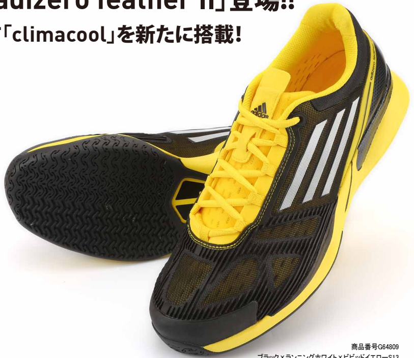
商品番号G64809 ブラック×ランニングホワイト×ビビッドイエロー-S13 ※錦織圭選手 着用予定

「climacool adizero feather II」はアディダス直営店の一部、adidas ONLINE SHOP (shop.adidas.jp)、アディダス取扱店(一部店舗除く)にて2012年12月中旬より発売予定となります。