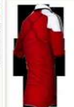
Her er den nye landsholdstrøje til EM-slutrunde i Polen og Ukraine.

Den er rød og hvid. Meget tætsiddende. Og så minder den om noget... Hvis du tænker 1992, når du ser de nye landsholdstrøjer, er du ikke helt galt på den.