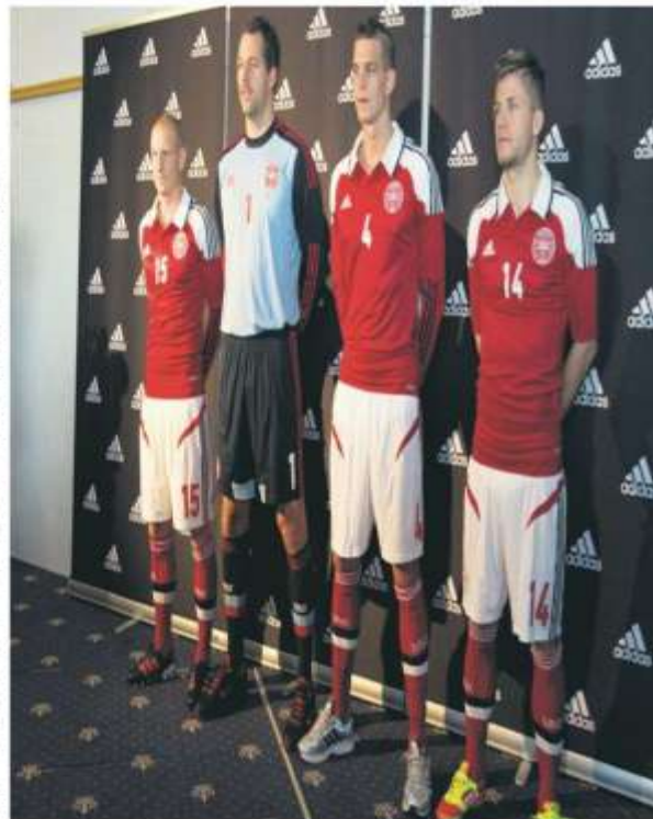
Her er den så. I går blev den nye landsholdstrøje præsenteret i landsholdstrøjen. Fra venstre: Niki Zimling, Thomas Sørensen, Daniel Agger og Lasse Schöne.

Da kan se trøjerne i aktion i aften, hvor Danmark spiller arvefølgespillet mod Sverige.